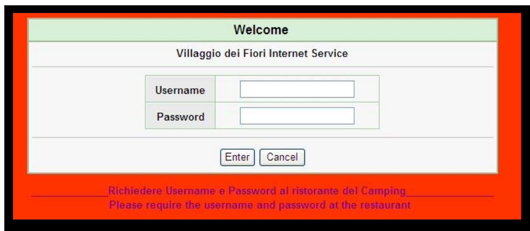
Schermata tipo per l'inserimento del "nome utente" e della "parola chiave"

Per accedere al servizio bisogna attivare il browser (per esempio "internet explorer") e, una volta apparsa la schermata di default, basta inserire il proprio "nome utente" e la propria "parola chiave" negli appositi spazi.