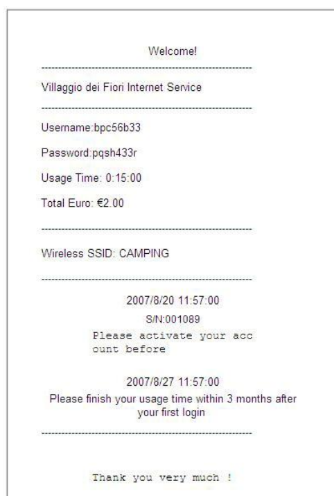
Scontrino tipo con riportati i dati per il LOGIN

Per ottenere il "nome utente" e la "parola chiave" basta richiederli al personale del ristorante del Villaggio che, previo registrazione di alcuni dati (tipo di documento, dati anagrafici, data e ora del rilascio del "nome utente", durata della connessione...), provvederà al rilascio di uno scontrino con i dati richiesti.